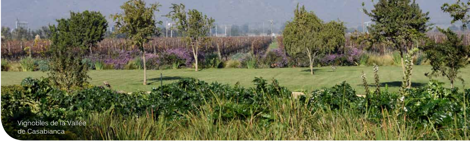
Vignobles de la Vallée de Casabianca