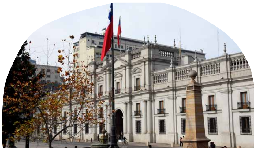
Palais de Moneda à Santiago

En 2007, propulsé par la présidente Michelle Bachelet, Sernatur crée un nouveau programme destiné aux jeunes étudiants, qui débute aussi avec 3 destinations touristiques. C'est l'année aussi de l'internationalisation du programme pour les seniors et des échanges avec le Brésil se réalisent avec grand succès parmi les bénéficiaires. En 2012, le programme pour les jeunes est présent dans tout le pays et le programme pour les seniors compte sur plus de 21 destinations touristiques pour les deux quotas; c'est aussi le début du programme intrarégional pour les seniors. Tout récemment, en 2015, et encore à la demande de la présidente Bachelet, Sernatur a créé le programme pour les familles les plus démunies, en ayant un accent tout particulier par les mères monoparentales.